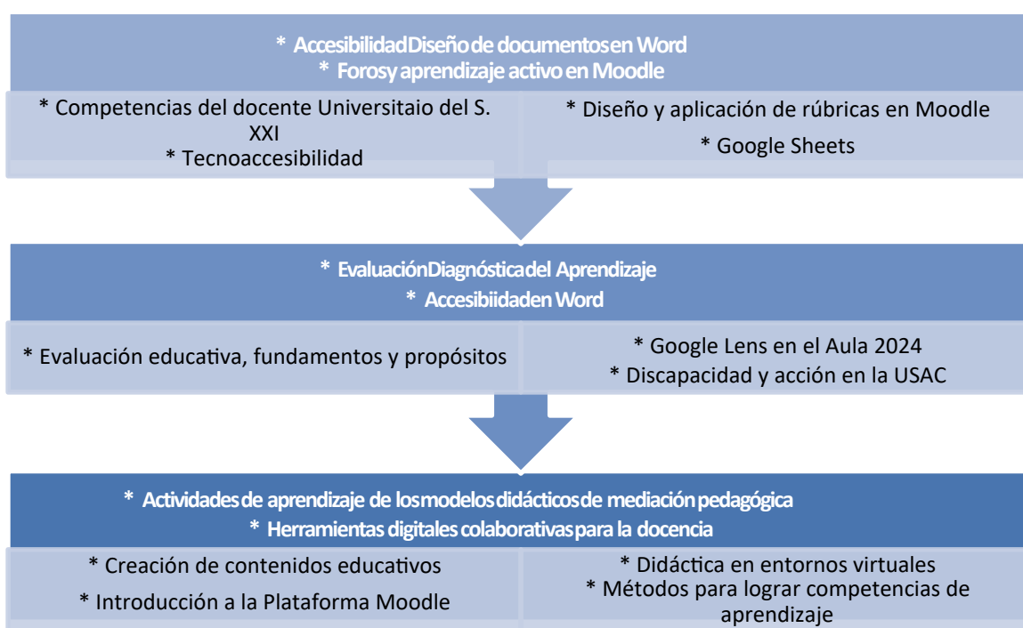
Figura 1. Presentación de cursos para la capacitación y formación docente continua

Con un período tan extenso como lo fue la pandemia y aunado a ello la toma de la universidad por un tiempo más, esto representó para todos los sectores que la conforman un reto en la continuación de la educación pública; llevando a cabo evaluaciones, buscando alternativas e implementando nuevos mecanismos para el