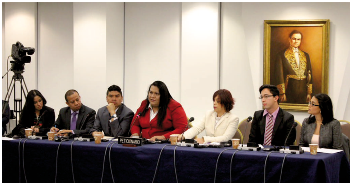
Audiencia "Información sobre discriminación por orientación sexual e identidad de género en Guatemala". Participantes: Fundación Myrna Mack, Red Legal y su Observatorio de Derechos Humanos y VIH, y Estado de Guatemala. 4 de noviembre de 2012, 146 Período de Sesiones de la CIDH.

El 146.º período de sesiones de la CIDH se realizó del 29 de octubre al 16 de noviembre de 2012. El domingo 4 de noviembre de 2012 se realizaron dos audiencias públicas en las que participaron el Estado de Guatemala y la Procuraduría de los Derechos Humanos. En la primera se presentó 'Información sobre violencia sexual contra mujeres y niñas en Guatemala' y en la segunda, 'Información sobre discriminación por orientación sexual e identidad de género en Guatemala.'