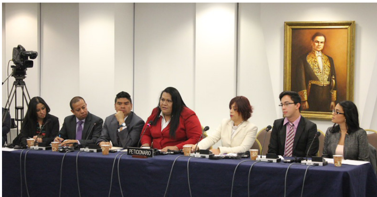
Audiencia "Información sobre discriminación por orientación sexual e identidad de género en Guatemala". Participantes: Fundación Myrna Mack, Red Legal y su Observatorio de Derechos Humanos y VIH, y Estado de Guatemala. 4 de noviembre de 2012, 146 Período de Sesiones de la CIDH.

El 146.º período de sesiones de la CIDH se realizó del 29 de octubre al 16 de noviembre de 2012. El domingo 4 de noviembre de 2012 se realizaron dos audiencias públicas en las que participaron el Estado de Guatemala y la Procuraduría de los Derechos Humanos. En la primera se presentó 'Información sobre violencia sexual contra mujeres y niñas en Guatemala' y en la segunda, 'Información sobre discriminación por orientación sexual e identidad de género en Guatemala.'