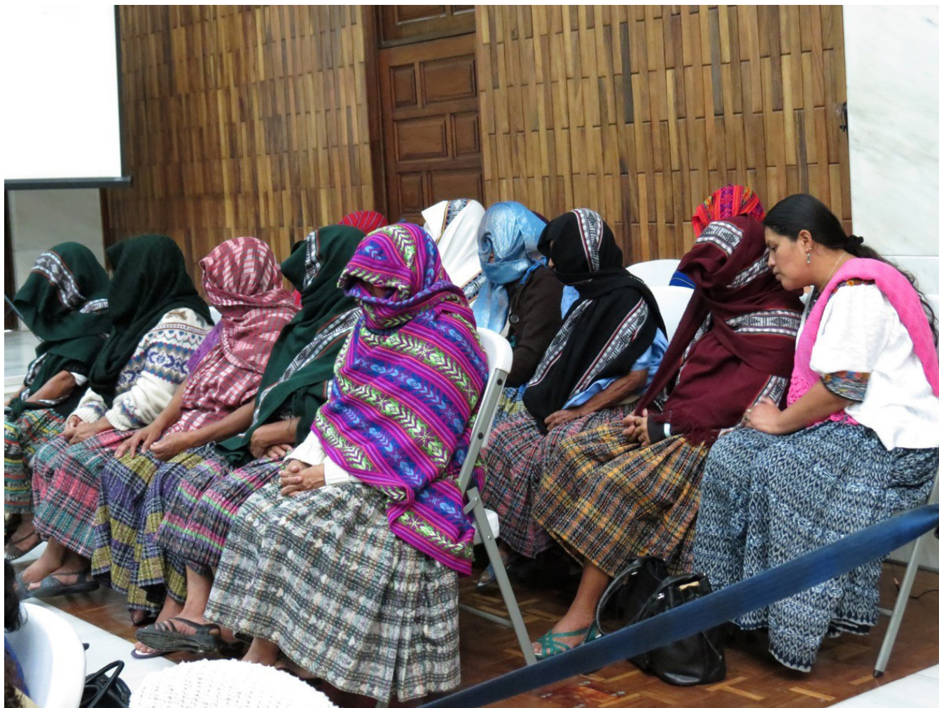
Imagen del juicio por violaciones en la aldea Sepur Zarco

Dado el contexto cultural de Guatemala en el que las niñas, mujeres adolescentes y mujeres adultas se ven sometidas a los delitos de violencia sexual, explotación y trata de personas como consecuencia del conflicto armado, en 2009 se emitió la Ley contra la Violencia Sexual, Explotación y Trata de Personas. Su principal objetivo es combatir estos delitos, en sus diferentes expresiones.