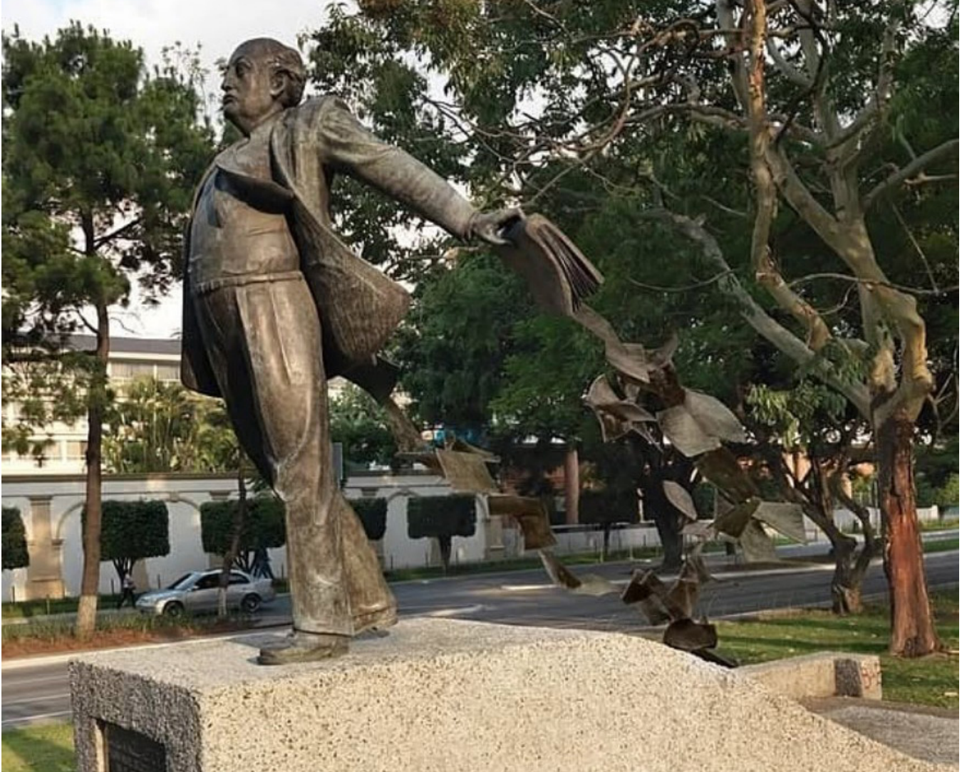
Monumento a Miguel Ángel Asturias, Avenida La Reforma, Ciudad de Guatemala, 2.84 mts. Instalado a finales de 1999. El escultor Max Leiva realizó un montaje digital para agregar las hojas que se desprenden de los libros fueron arrancadas por vándalos en 2003.