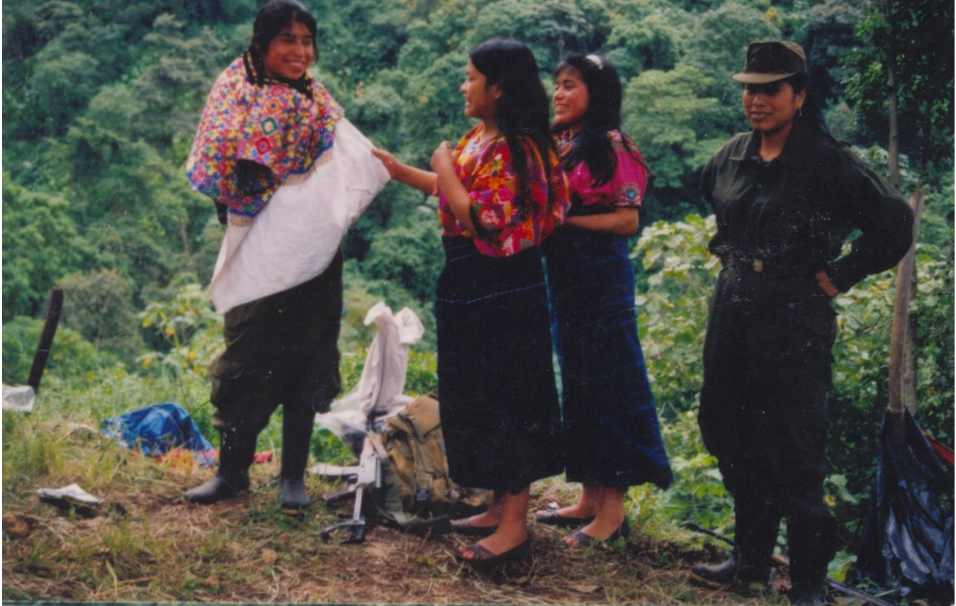
En uno de los campamentos de desmovilización del Ejército Guerrillero de los Pobres (EGP) ubicado en Tzalbal, municipio de Nebaj, Quiché. Fotografía de Jorge Uzon del 24 de marzo de 1997.