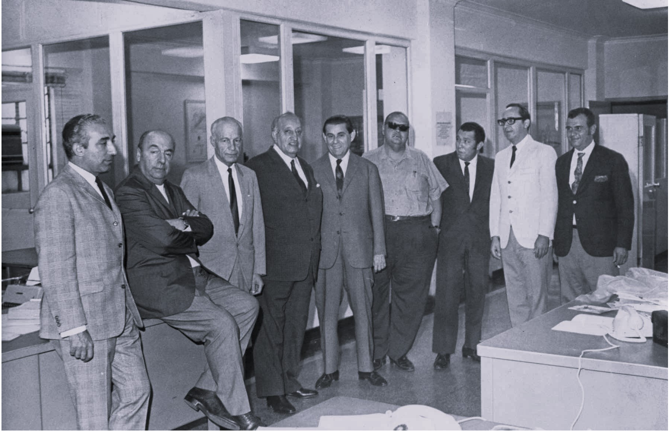
Miguel Ángel Asturias en la redacción del diario El Nacional, Caracas, Venezuela. El segundo de izquierda a derecha es Pablo Neruda.

Asturias recurre al modelo positivista para superar el «atraso» guatemalteco con la asimilación del pueblo indígena. Su propuesta incluye el temor del ladino frente a la cultura europea. Miguel Ángel escribió: «El estudio de nuestras sociedades ha de ponernos en posibilidad de hacer de Guatemala una nación racial, cultural, lingüística y económicamente idéntica». (pág. 34).