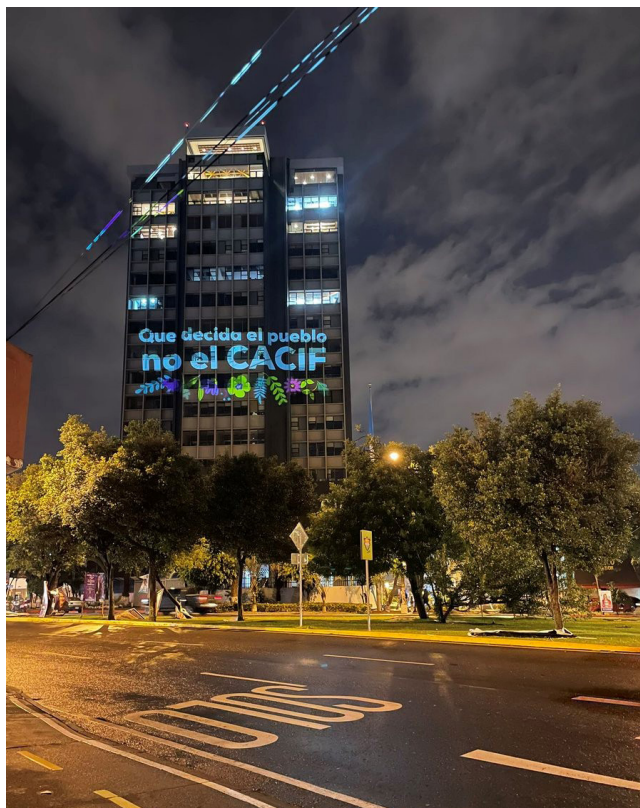
Proyecciones de simpatizantes del Movimiento Semilla durante el periodo de campaña, en las instalaciones del edificio que alberga cámaras de las patronales guatemaltecas.