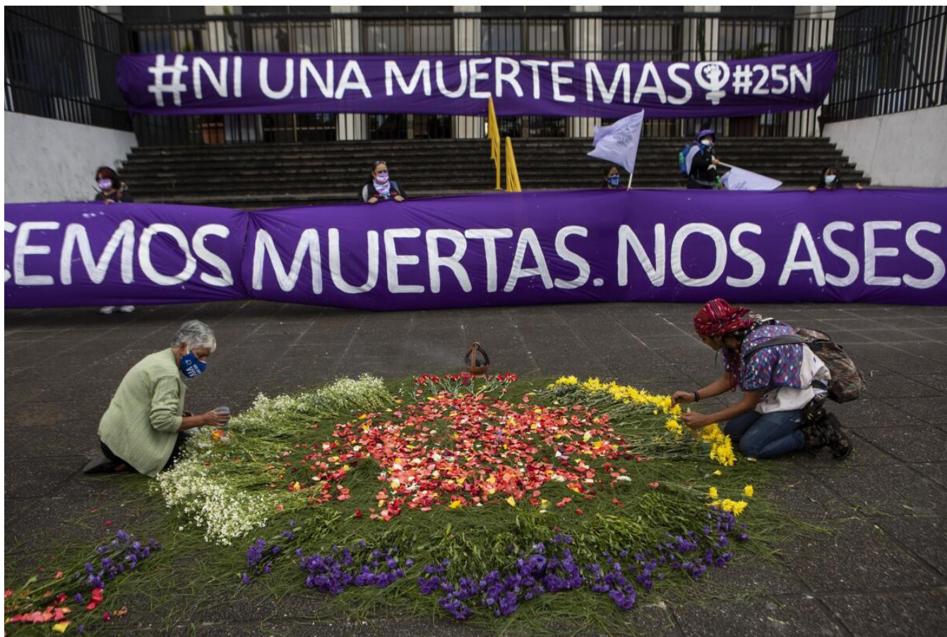
Imagen del juicio por violaciones en la aldea Sepur Zarco

Las Naciones Unidas (1979) resaltan y se centran en la no discriminación, creación de medidas de políticas; garantía de los derechos humanos y libertades fundamentales; medidas especiales contra estereotipos, prejuicios y prostitución; vida política y pública; representación; nacionalidad; educación; empleo; salud; mecanismos de protección social; atención a las mujeres rurales; igualdad ante la ley, estabilidad en el matrimonio y resguardo de la familia.