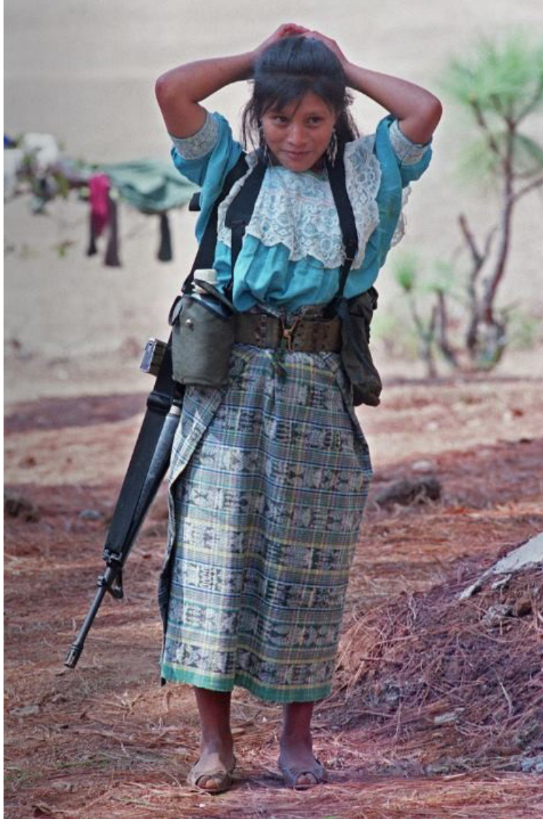
En uno de los campamentos de desmovilización del Ejército Guerrillero de los Pobres (EGP) ubicado en Tzabal, municipio de Nebaj, Quiché. Fotografía de Jorge Uzon del 24 de marzo de 1997.