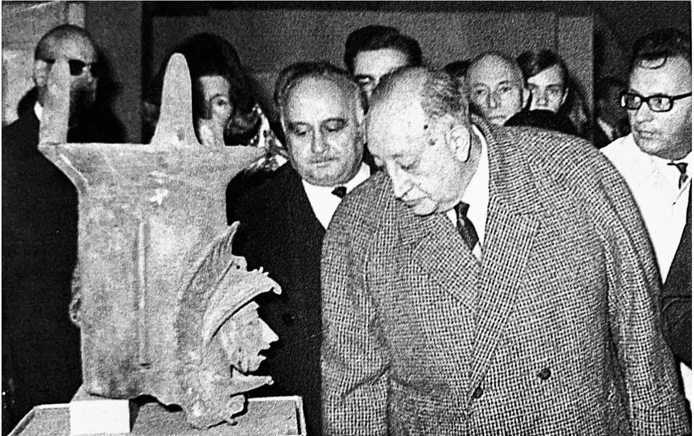
Miguel Ángel Asturias inauguró una exposición de arte maya en Bordeaux.