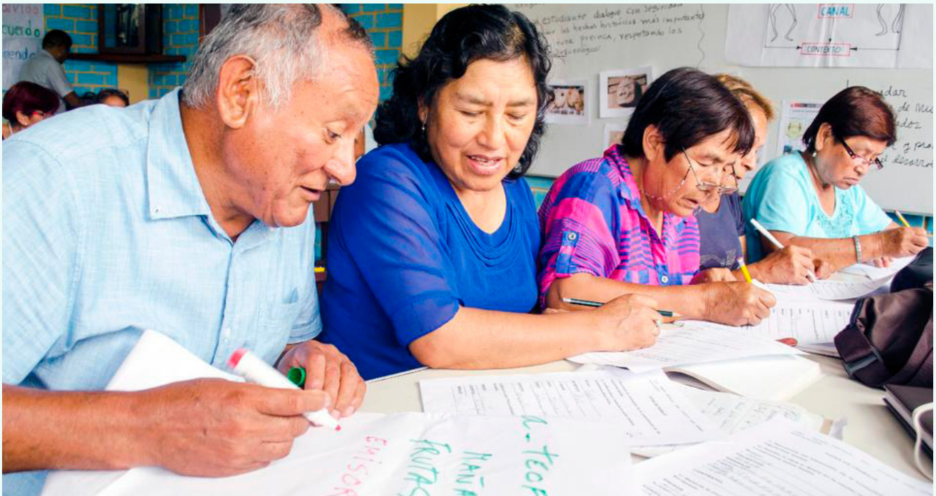
Fotografía: Intellectual Reserve, 2020