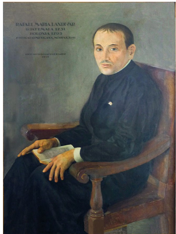
Rafael Landívar, óleo sobre lienzo por Alfredo Gálvez Suárez (1931). Museo de la Universidad de San Carlos de Guatemala.

fuego por aquella claraboya, mataron a uno, pasaron a otro de un balazo, y se dió el tercero. Sacados de allí, al uno que estaba moribundo lo procuraron auxiliar, y a poco tiempo murió. Al punto, aunque era día de fiesta los arrastraron a la horca, ahorcaron al que vivió, colgando de ella los otros dos cadáveres.